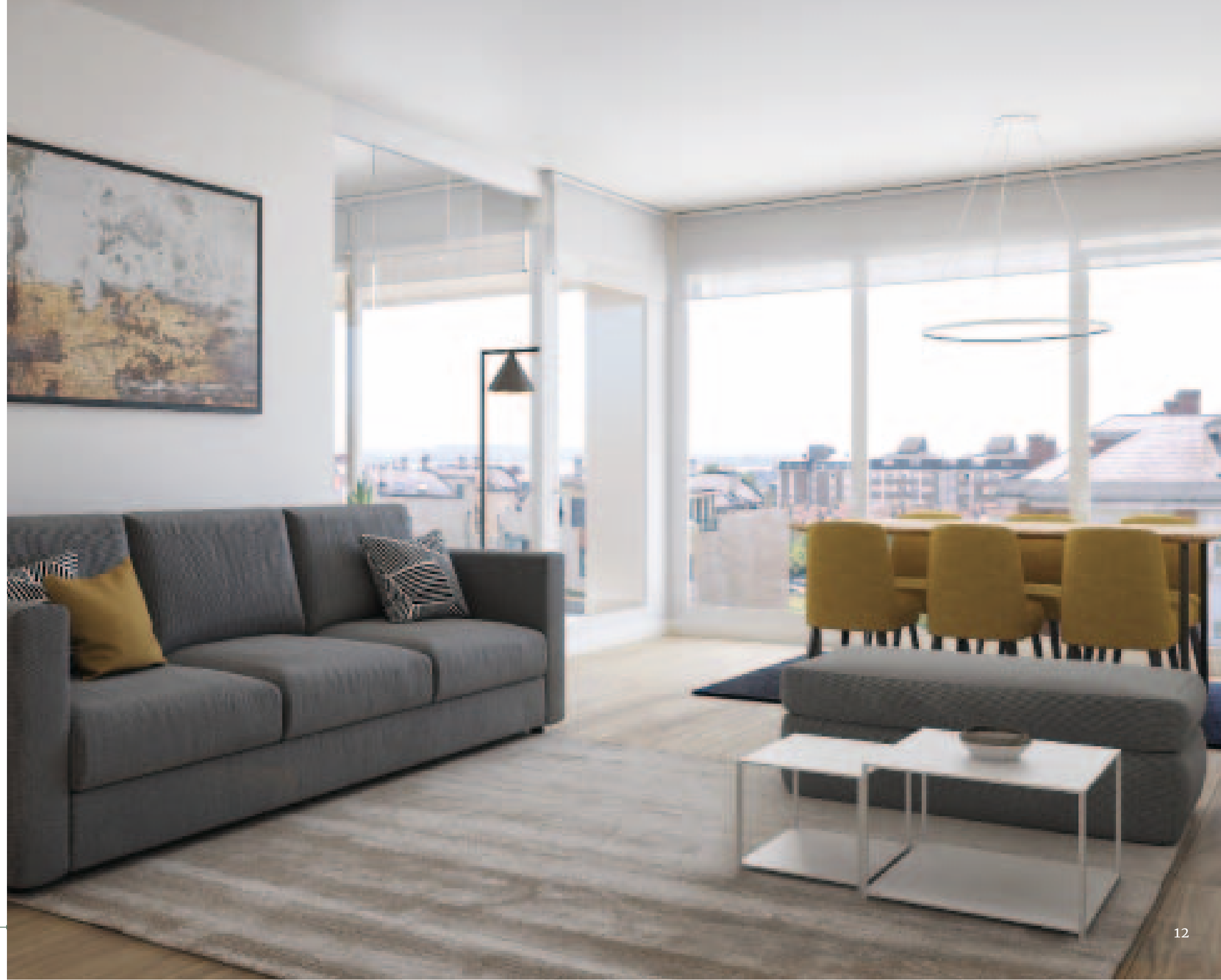
Zona de día. Ventanales.

Las viviendas están diseñadas para dar amplitud a la zona de día (estar-comedor, cocina y terraza), configurándose ésta, como un espacio continuo; por otra parte, hay una clara separación de la zona de noche, minimizando los espacios de circulación.