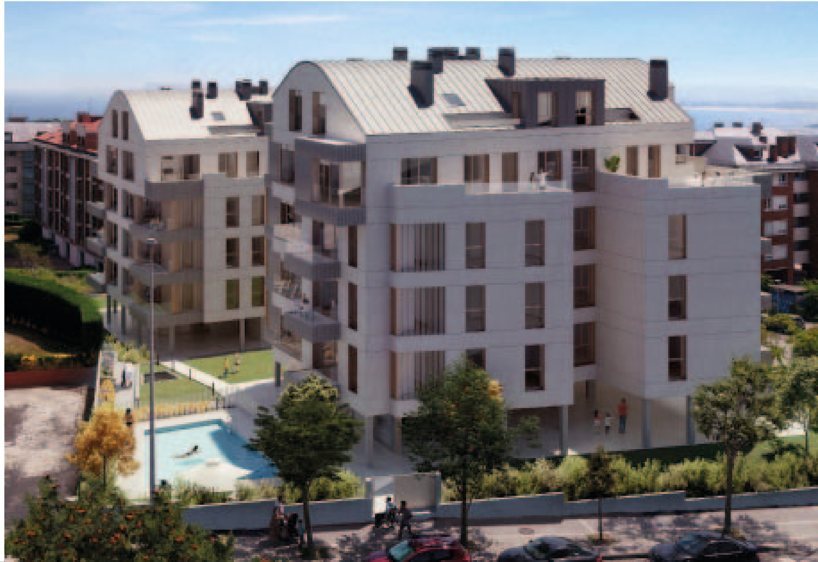
Vista fachada lateral y piscina

Valdenoja es la zona de expansión natural de El Sardinero , urbanizada hace poco más de dos décadas; se trata de una zona de alta calidad ambiental próxima a espacios verdes como el golf y el parque de Mataleñas y las playas de Mataleñas y Los Molinucos.